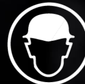
PROTECCIÓN PARA LA CABEZA