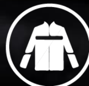
ROPA DE PROTECCIÓN