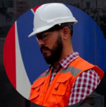
PROTECCIÓN PARA LA CABEZA