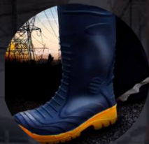
CALZADO DE SEGURIDAD