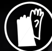
PROTECCIÓN DE MANOS