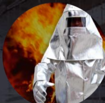
PROTECCIÓN ALTAS TEMPERATURAS