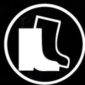
CALZADO DE SEGURIDAD